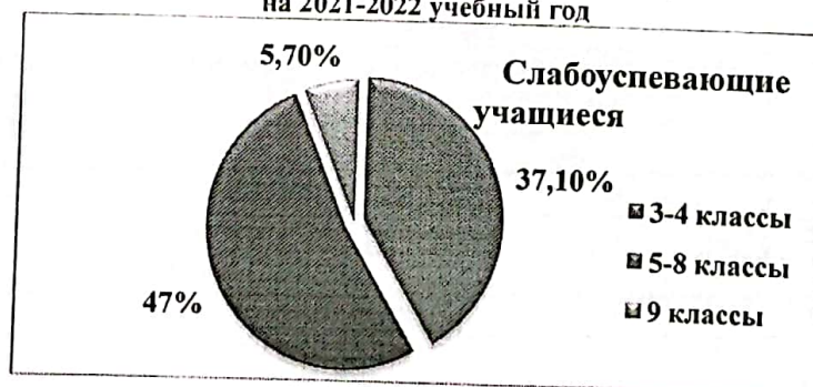
Качественный мониторинг слабоуспевающих учащихся на 2021-2022 учебный год